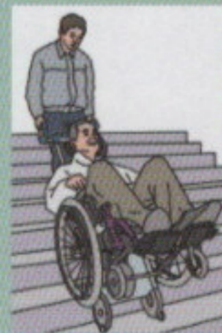
イラスト① 可搬型階段昇降機