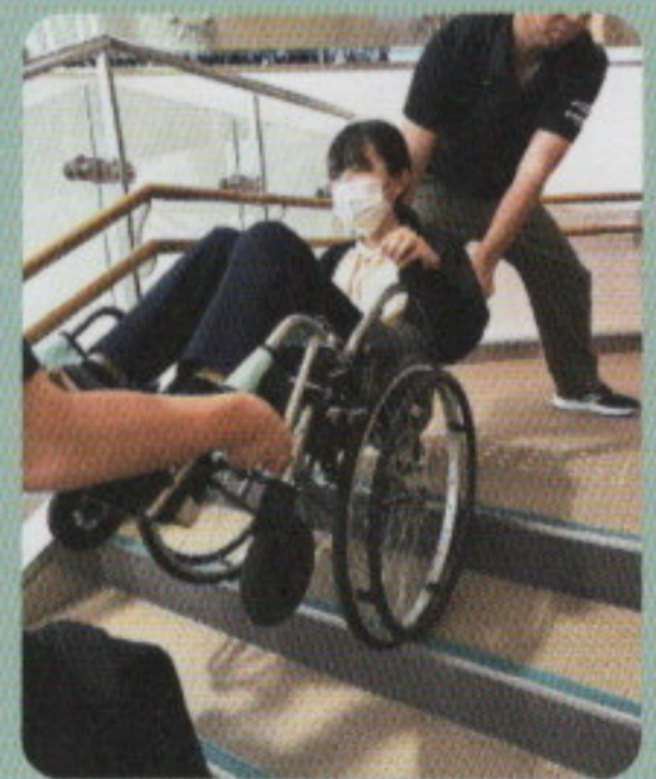
画像① 二人介助での車いす搬送