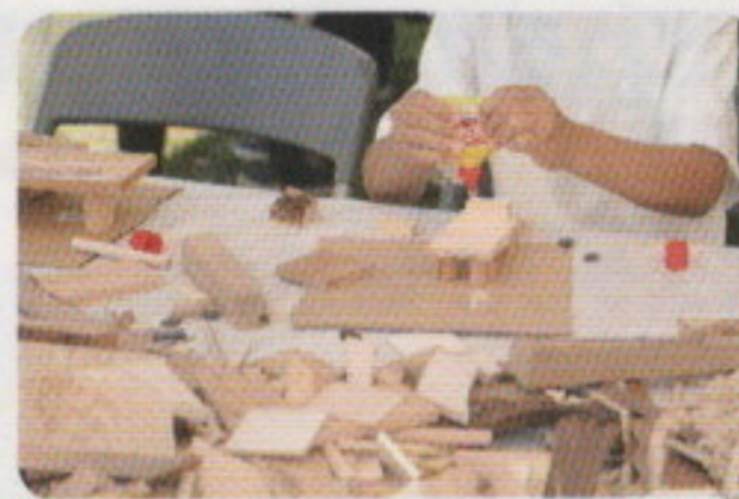
木工ワークショップ